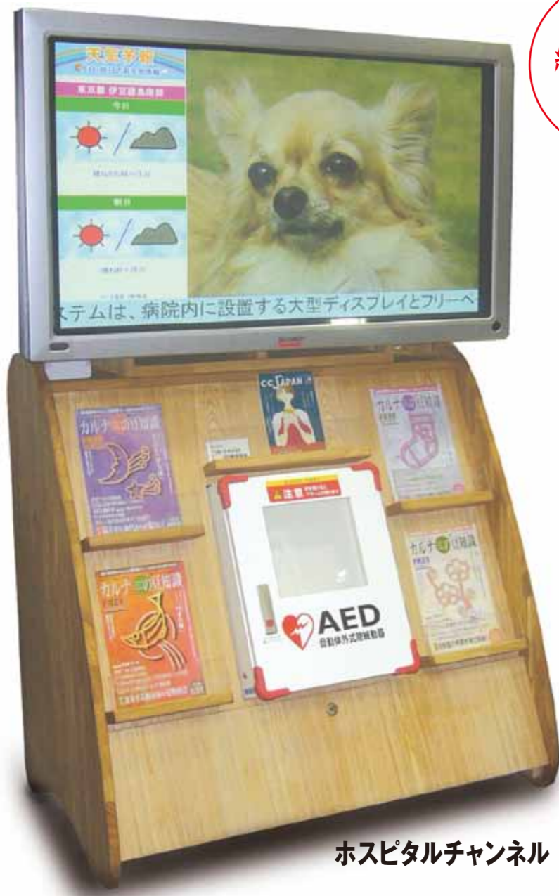
ホスピタルチャンネル